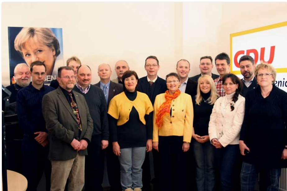
Unser Team für Treptow-Köpenick

Im Bereich Sportförderung und der Zuwendungen an Sportverbände, wie z.B. den Schülerruderverband, werden wir uns für eine Erhöhung der Mittel einsetzen. Auch bei der baulichen Unterhaltung streben wir eine Mittelaufstockung an, um die Rahmenbedingungen für alle Sportvereine, insbesondere bei der Betreuung von Kindern und Jugendlichen, zu verbessern.